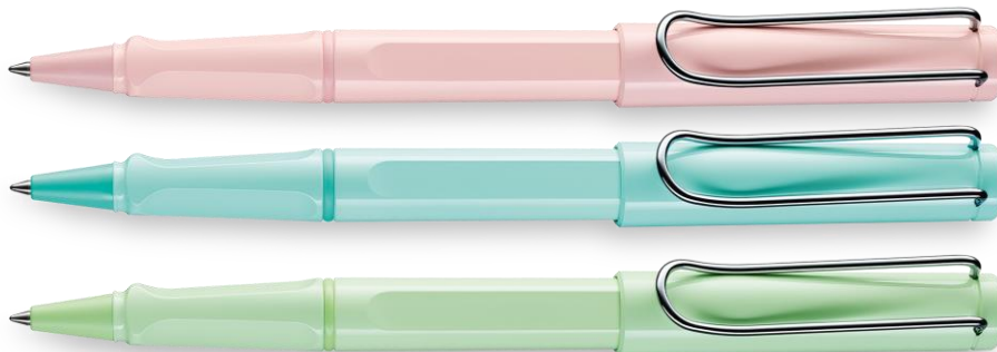
LAMY safari pastel – Tintenroller